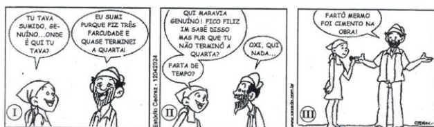
CEDRAZ. Xaxado. Passatempos.

Nesses quadrinhos, o motivo que gera a confusão desencadeadora de humor está presente