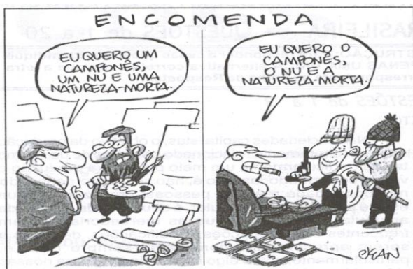
JEAN. Encomenda. Folha de S. Paulo, São Paulo., Opinião.

Marque V ou F conforme sejam as afirmações verdadeiras ou falsas.