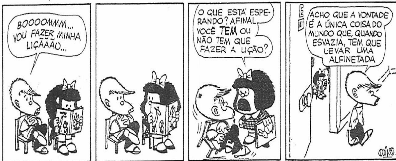
LAVADO, Joaquin Salvador. Toda Mafalda. São Paulo: Martins Fontes, 2000. p. 12.