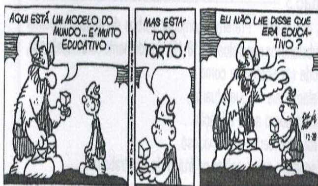
BROWNE, Dik. O melhor de Hagar, o horrível. Porto Alegre: L&PM, 2007. v. 5, p.31. (Coleção L&PM Pocket).

A única afirmativa sem comprovação no texto é a da alternativa: