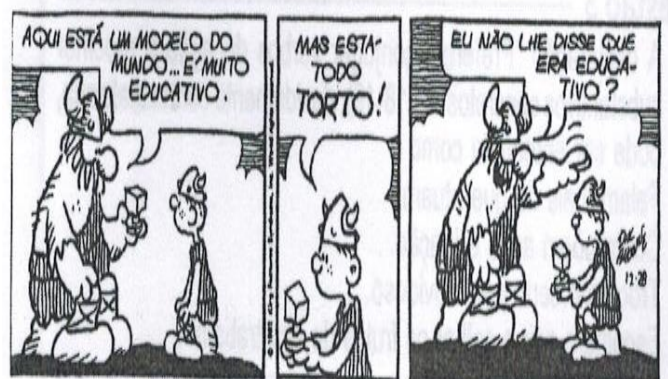
BROWNE, Dik. O melhor de Hagar, o horrível. Porto Alegre: L&PM, 2007. v. 5, p.31. (Coleção L&PM Pocket).

A única afirmativa sem comprovação no texto é a da alternativa: